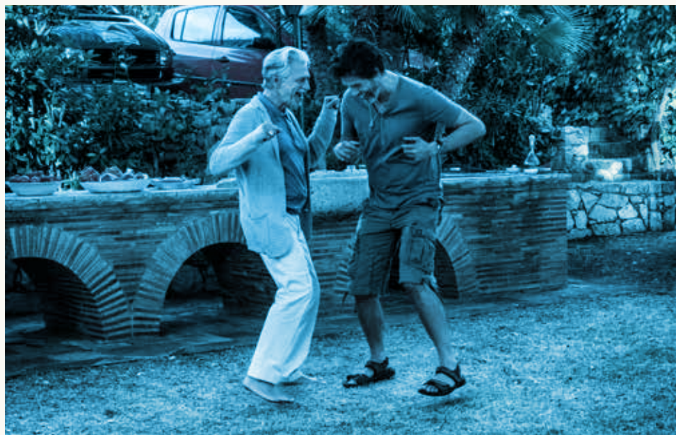
Photogramme mis en couleur du film Croce e delizia de Simone Godano présenté pendant les 35 es JOURNÉES DU CINÉMA ITALIEN